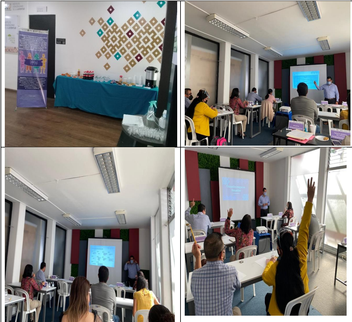
Día 23 de septiembre. Mesa 1 Reunión 2; Mesa de trabajo para impulsar las acciones del proyecto Fondo del Bienestar y el Avance de las Mujeres (FOBAM) se incorporen al plan de trabajo 2020 del Grupo Estatal para la Prevención del Embarazo Adolescente (GEPEA).