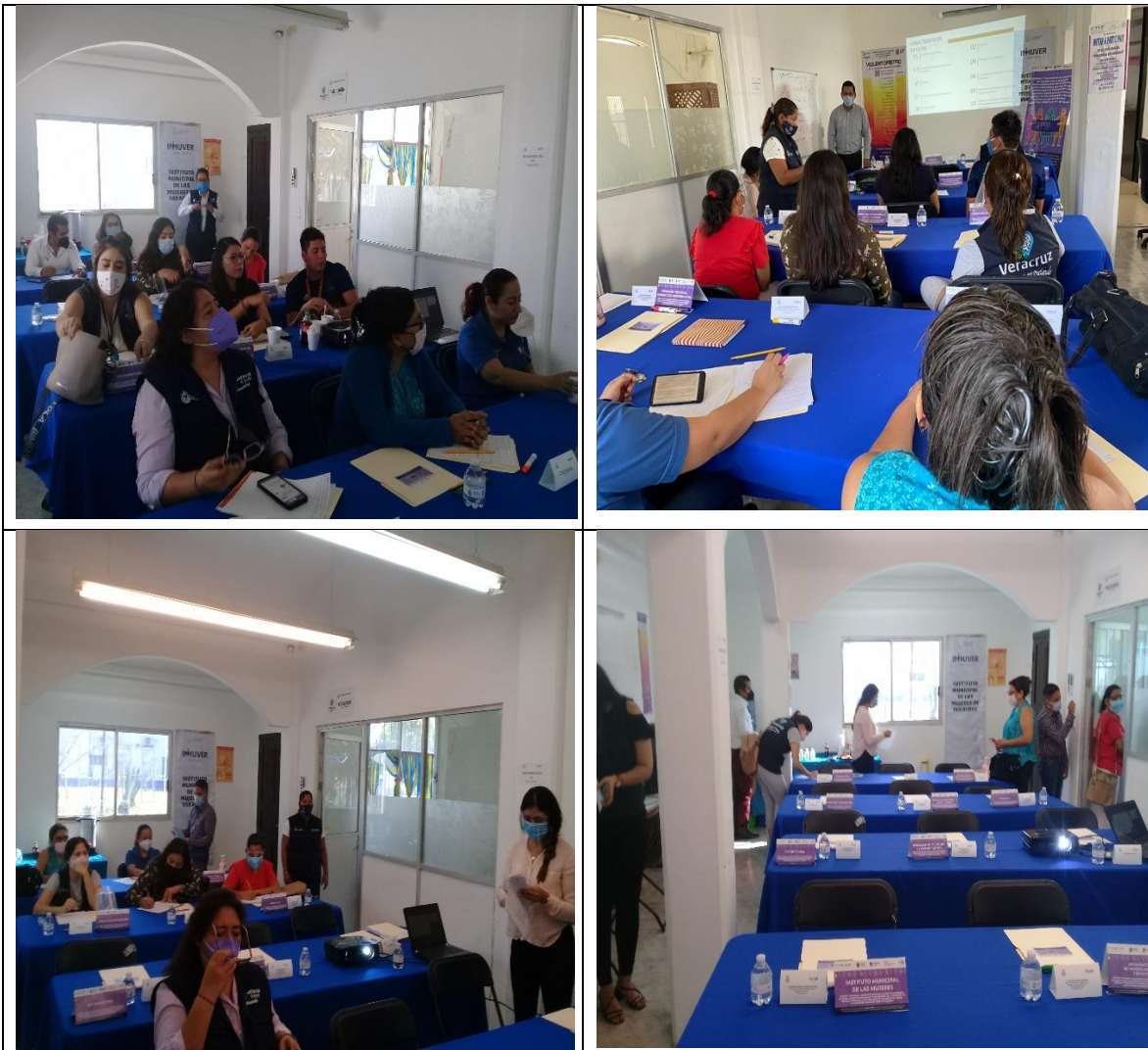
Día 05 de octubre. Elaborar estrategias y plan de trabajo con un municipio de alta o muy alta tasa de embarazo infantil o adolescente (GIPEA-Veracruz).

Temas de Educación Integral en Sexualidad, mencionando sobre todo el impacto en la economía, los antecedentes del ENAPEA, induciendo a los integrantes a establecer su estrategia y plan de trabajo en conjunto por parte las dependencias las cuales asistieron.