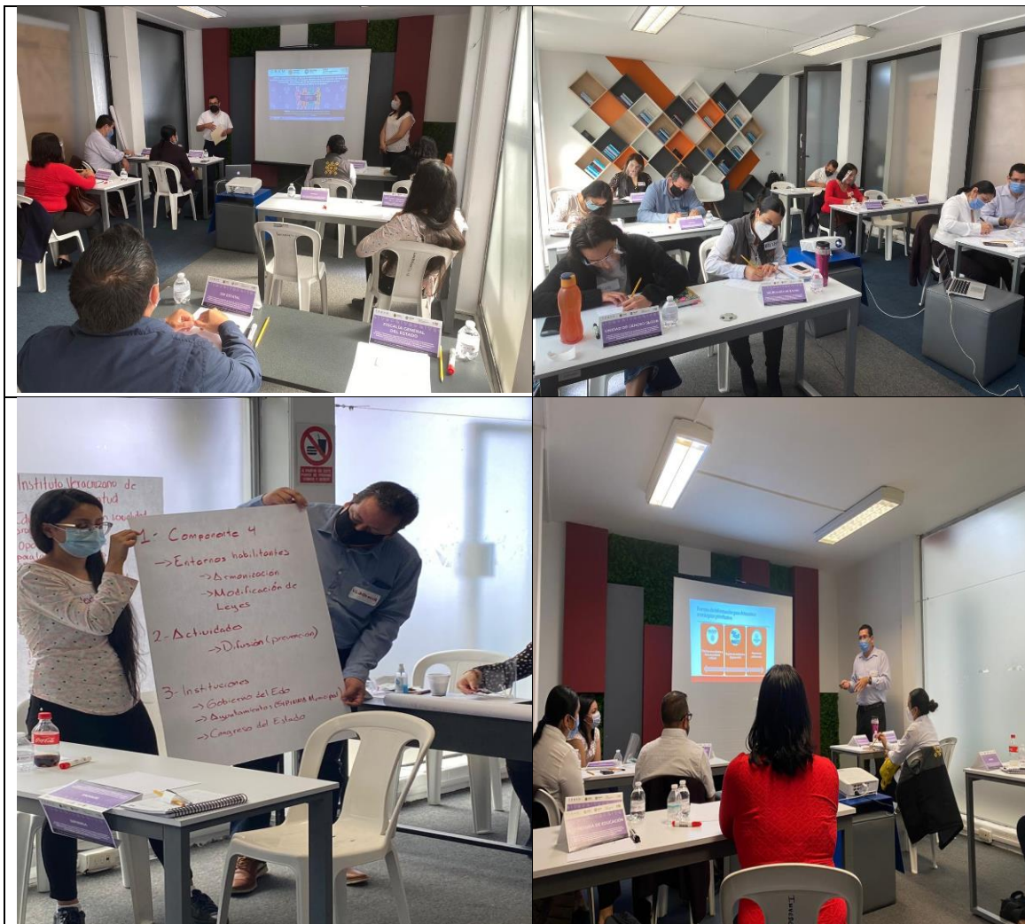
Día 21 de septiembre. Mesa 1 Reunión 1; Mesa de trabajo para impulsar las acciones del proyecto Fondo del Bienestar y el Avance de las Mujeres (FOBAM) se incorporen al plan de trabajo 2020 del Grupo Estatal para la Prevención del Embarazo Adolescente (GEPEA).