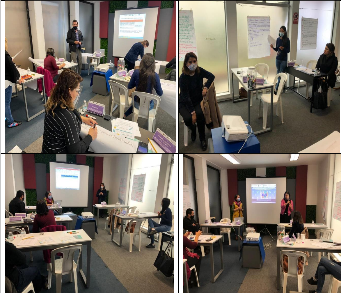
Día 29 de septiembre. Mesa 2 Reunión 2; cierre de actividad. Mesa de trabajo para impulsar las acciones del proyecto Fondo del Bienestar y el Avance de las Mujeres (FOBAM) se incorporen al plan de trabajo 2020 del Grupo Estatal para la Prevención del Embarazo Adolescente (GEPEA).