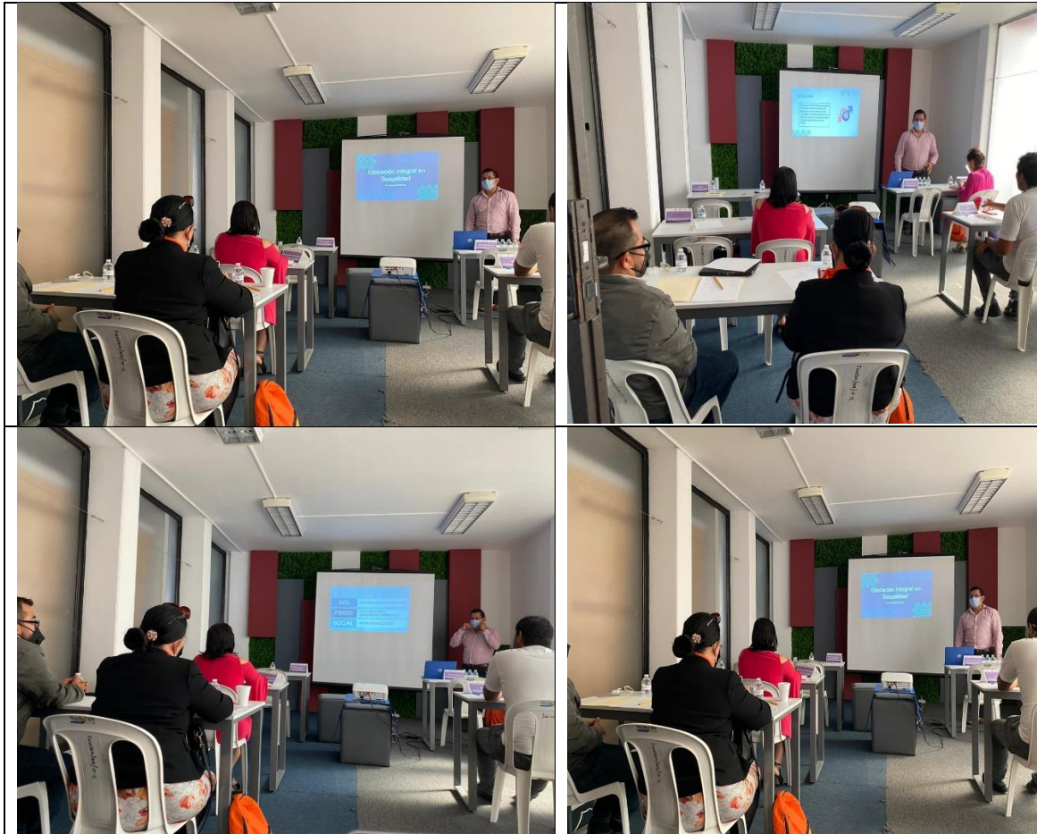
Día 25 de septiembre. Mesa 2 Reunión 1; Mesa de trabajo para impulsar las acciones del proyecto Fondo del Bienestar y el Avance de las Mujeres (FOBAM) se incorporen al plan de trabajo 2020 del Grupo Estatal para la Prevención del Embarazo Adolescente (GEPEA).