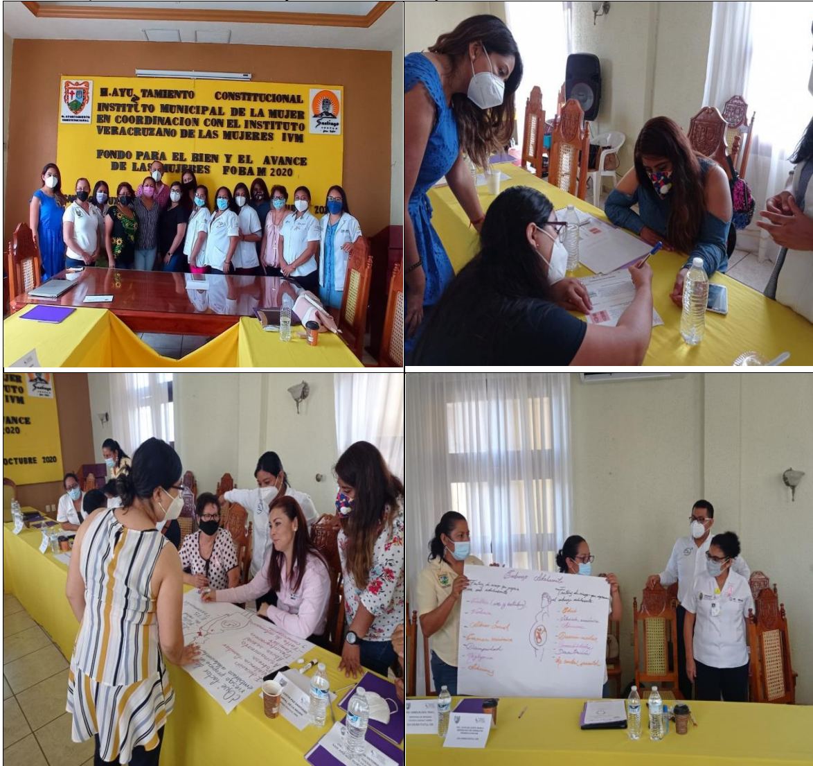
Día 15 y 16 de octubre. Implementar una escuela de Liderazgo Adolescente en la ciudad de Córdoba. Se llevo a cabo con actores estratégicos del municipio de Santiago Tuxtla y san Andrés Tuxtla.