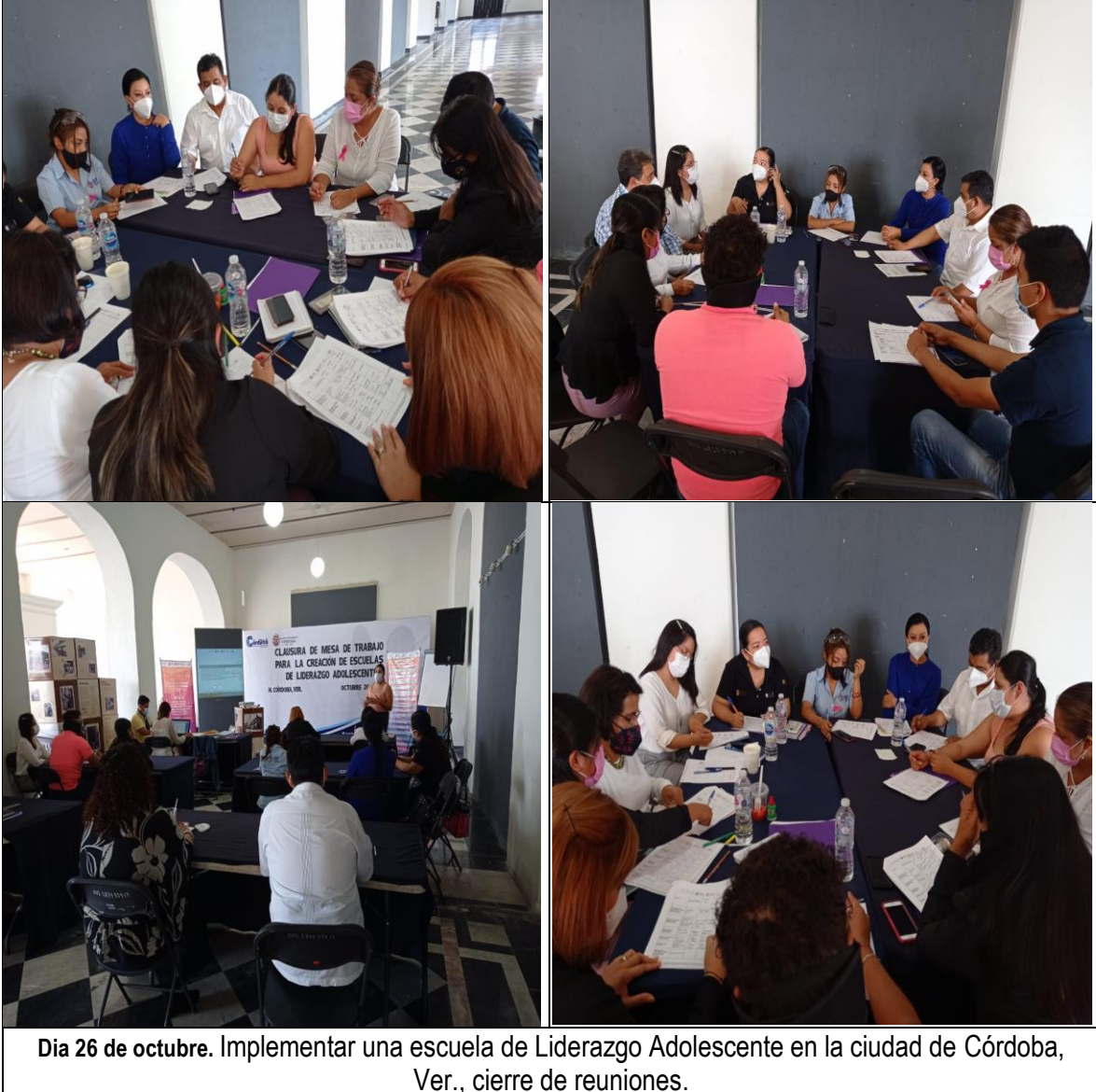
Día 26 de octubre. Implementar una escuela de Liderazgo Adolescente en la ciudad de Córdoba, Ver., cierre de reuniones.