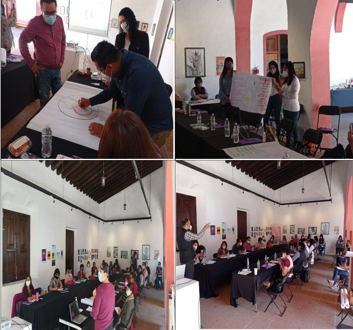
Día 20 y 22 de octubre. Implementar una escuela de Liderazgo Adolescente en la ciudad de Xalapa. Se llevo a cabo con actores estratégicos del municipio de Xalapa, Ver.