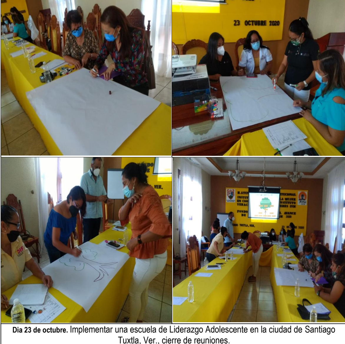
Día 23 de octubre. Implementar una escuela de Liderazgo Adolescente en la ciudad de Santiago Tuxtla, Ver., cierre de reuniones.