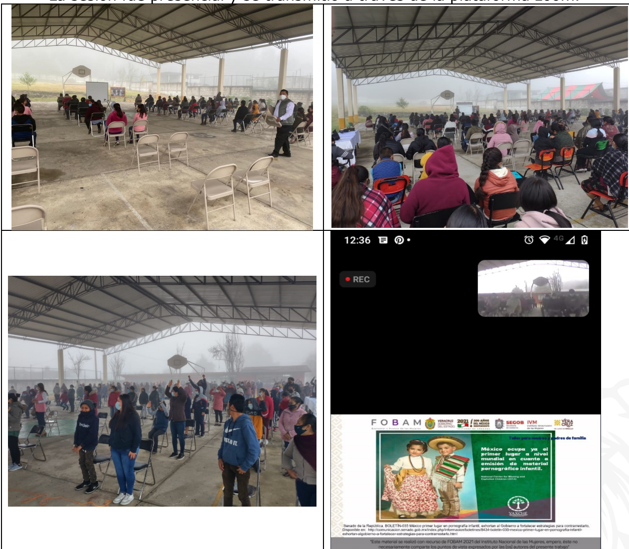
29 de octubre. Información y sensibilización dirigida a madres y padres sobre Educación Integral en Sexualidad (EIS). Tetelzingo, municipio de Coscomatepec.

La sesión fue presencial y se transmitió a través de la plataforma zoom.