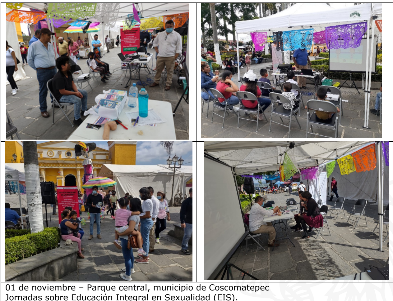
01 de noviembre – Parque central, municipio de Coscomatepec Jornadas sobre Educación Integral en Sexualidad (EIS).

Se dio información a público en general, poniendo énfasis en atraer a adolescentes y jóvenes, con el propósito de dar información sobre Educación Integral en Sexualidad (derechos sexuales de jóvenes, qué es la Educación Integral en Sexualidad y Servicios, servicios amigables) uso correcto del uso de los condones masculino y femenino, prevención de embarazo en adolescentes y prevención del abuso sexual en niñas y niños. Los registros muestran un alcance de 100 1 personas (59 mujeres y 41 hombres), del mismo municipio, así como de municipios de la zona (montañas) Alpatláhuac, Calchualco, Córdoba, Acultzingo, Fortín, Huatusco, Ixhuatlán del Café, Orizaba, Tepatlaxco, Tomatlán, Totocinapa, Váquez Vela.