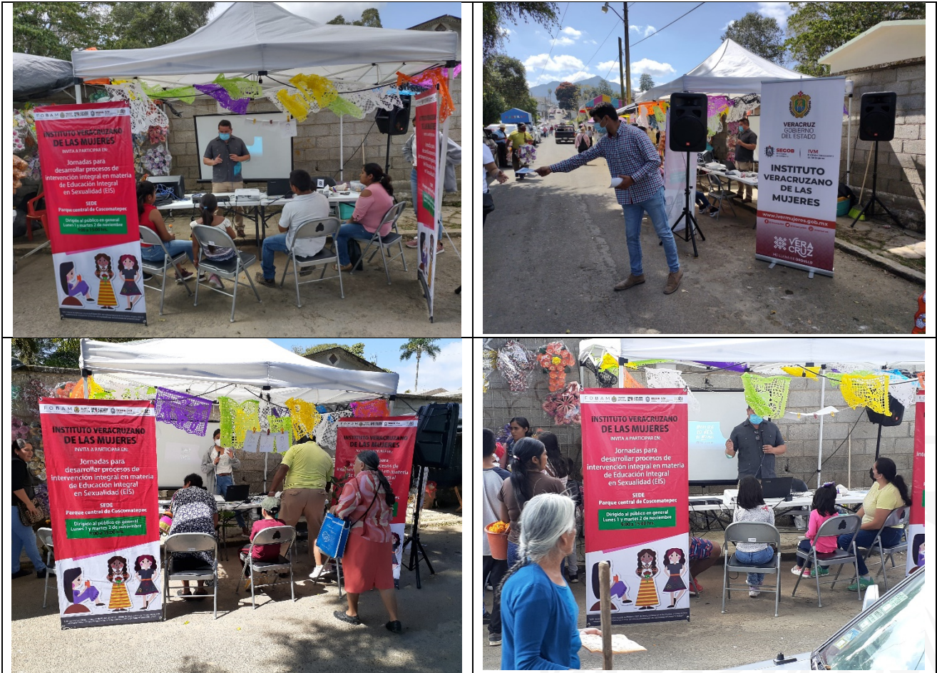
02 de noviembre- Acceso al panteón, municipio Coscomatepec Jornadas sobre Educación Integral en Sexualidad (EIS).

De acuerdo con la información registrada se tuvo un alcance de 81 2 personas (51 mujeres y 30 hombres). La procedencia de las personas que recibieron información fueron Ayahualulco, Calchahualco, Coscomatepec, Huatusco, Ixhuatlán del Café y Tlaxo.